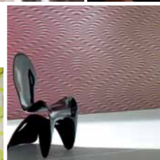
Luigi Colani Collection by marburg wallcoverings