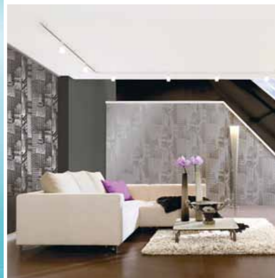
Kollektion Manhattan – AS Création

Wand. Der Untergrund wird dabei nicht beschädigt und ist direkt bereit für die nächste Tapezierung. Öfter mal Tapetenwechsel, kein Problem! Vliestapeten sind dimensionsstabil, brauchen keine Weichzeit, sind schwer entflammbar, haben eine hohe Dampfdurchlässigkeit, sind weitgehend reissfest und biologisch abbaubar.