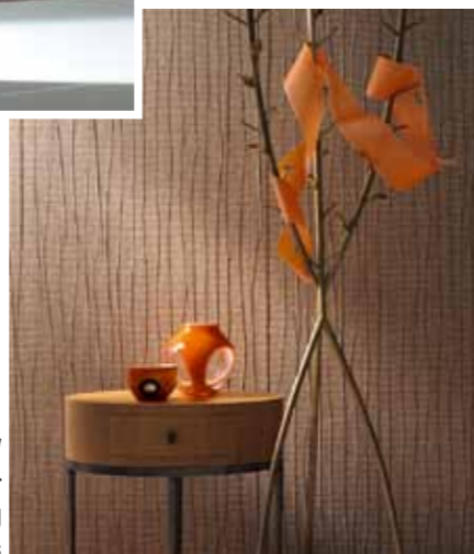
Wall Couture by Ulf Moritz – marburg wallcoverings

langwierige Arbeit mit mühsamen Abkratzen und mit Dampfapparat. Das war einmal – mit der Papiertapete. Heute hat sie ausgedient und wurde durch die Vliestapete abgelöst. Diese hochbiologische