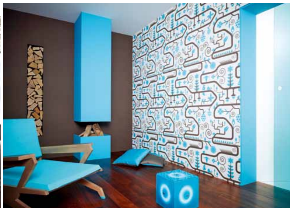
Lars Contzen 3 by AS Création