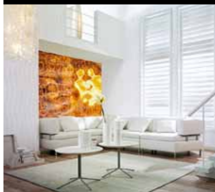
Erfurt und Sohn

Ein Schuss Inspiration und das nötige Flair genügen, um mit einer einzelnen Wand oder gar nur mit drei, vier Tapetenbahnen spannende Akzente zu setzen. Der Digitaldruck macht's möglich. Ob Ferienstimmungen, ob abstrakte Computer-Kompositionen, ob künstlerische Szenarien, alles kann in der Regel massgenau in der Wunschgrösse geliefert werden. Die Auswahl an fertigen Motiven ist in jeder Sparte sehr gross, zudem besteht die Möglichkeit, eigene Kreationen zu verwirklichen.