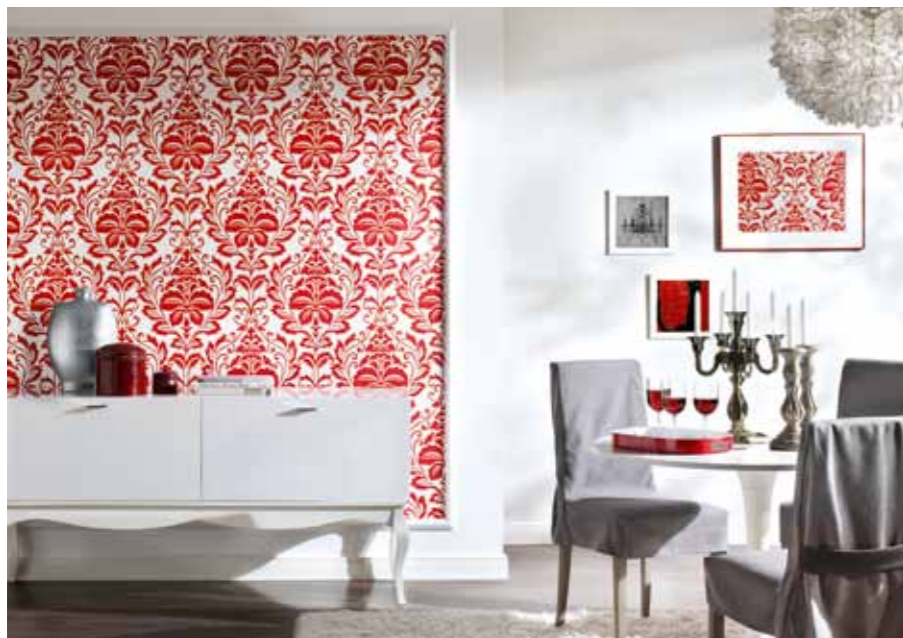
Kollektion Flock3 – AS Création