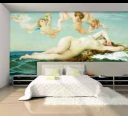
Erfurt und Sohn

Ein Schuss Inspiration und das nötige Flair genügen, um mit einer einzelnen Wand oder gar nur mit drei, vier Tapetenbahnen spannende Akzente zu setzen. Der Digitaldruck macht's möglich. Ob Ferienstimmungen, ob abstrakte Computer-Kompositionen, ob künstlerische Szenarien, alles kann in der Regel massgenau in der Wunschgrösse geliefert werden. Die Auswahl an fertigen Motiven ist in jeder Sparte sehr gross, zudem besteht die Möglichkeit, eigene Kreationen zu verwirklichen.