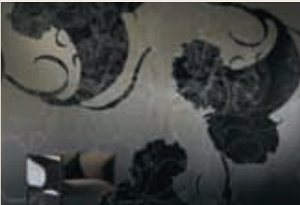
Gebr. Rasch, Kollektionen Maschek, Dessin Dawn

Das Gleiche gilt auch im Wohnbereich: Tapete ist nicht gleich Tapete, jede einzelne gibt einem Raum seinen speziellen Charakter, macht ihn zum Unikat. Dass dabei die Art des Designs unterschiedlicher nicht sein könnte, beweisen die Bilder zu diesem Beitrag.