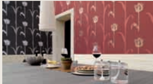
Gebr. Rasch, Kollektionen Woodland, Dessin 71097